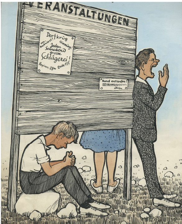
„Wenns heuer im Dorf kein Kulturleben hat, haun viel junge Bauersleut ab in die Stadt!“