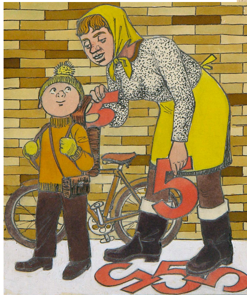
„Lauter Fümwen! Morgen nimmste den Lehra wat vonne Hausschlachtung mit!“