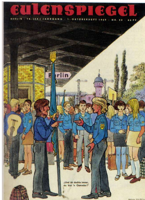
"Und ich dachte immer, du bist'n Gammler!" Aufgrund dieser Zeichnung wurde die Ausgabe eingestampft!